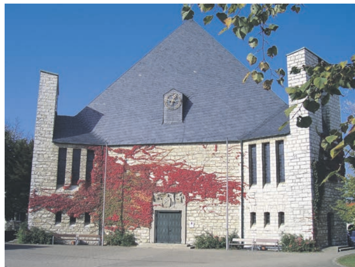
Die Kur- und Urlauberseelsorge lädt am Mittwoch, den 26.9.2018 um 21 Uhr zur „Bad Staffelsteiner Nachtmusik – Improvisationen und Variationen über Orgel und Saxophon“ in die Evangelische Kirche ein.