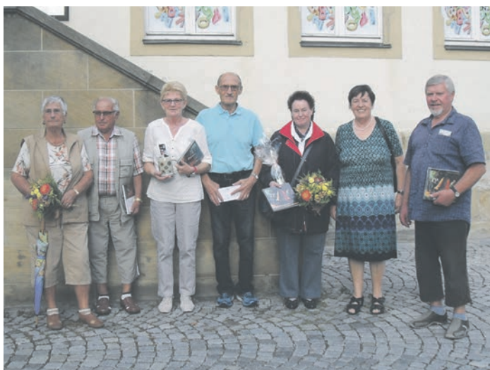
Die geehrten Urlaubsgäste, die seit 5, 10, 20 und 25 Jahren regelmäßig ihren Urlaub in Bad Staffelstein verbringen.

Am Dienstag, 4. September 2018, erhielten Gäste beim Informationsnachmittag im Museum der Stadt Bad Staffelstein einen ersten Eindruck über ihr Urlaubsgebiet. Außerdem informierte Alicia Poth vom Kur & Tourismus Service über die Stadt, die Obermain Therme und Veranstaltungen im Stadtgebiet. Im Rahmen dieser Veranstaltung wurden auch treue Urlaubsgäste geehrt.