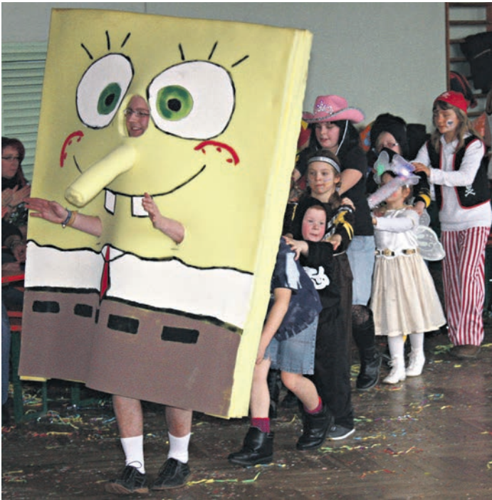
Der große SKK-Kinderfasching unter dem Motto: „Fabelwesen und Magie, der SKK weckt Fantasie“ beginnt am Sonntag, den 24.2.2019 um 14 Uhr in der Peter-J.-Moll Halle in Bad Staffelstein.

17 Uhr Gästeeinformation – Informationsnachmittag für Urlaubs- und Kurgäste. Ort: Stadtmuseum Bad Staffelstein, Kirchgasse 16 Veranstalter: Kur & Tourismus Service Bad Staffelstein