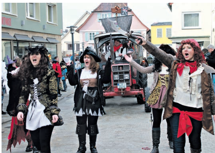
Zu den Faschings-Highlights in Bad Staffelstein und dem Ortsteil Uetzing gehören die Faschingsumzüge. Die jeweiligen Termine und auch weitere Faschingstermine entnehmen Sie bitte den Veranstaltungstipps.

Adam-Riese-Apotheke, Untere Gartenstr. 5, Bad Staffelstein, 09573/310556