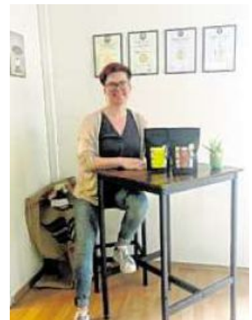
Die 180 Grad-Kaffeerösterei wurde mit zwei Goldmedaillen ausgezeichnet.

auch Röstkaffees ganz klar im Fokus. Die 180 Grad - Kaffeerösterei aus Bad Staffelstein hat bei der diesjährigen Verkostung gleich