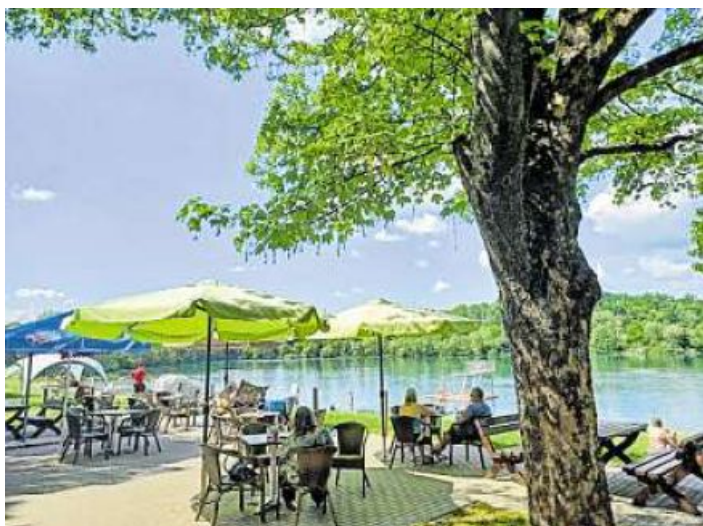
Ostsee Bad Staffelstein - der beliebte Badensee in Bad Staffelstein ist aus seinem Winterschlaf erwacht.