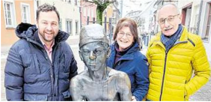
Zusammen mit der Kultur Initiative Staffelstein (KIS) und dem Quartiersmanagement der Stadt Bad Staffelstein wurde im Januar zur Abgabe von Vorschlägen zum Bürgerwettbewerb „Zahlenwerkstatt“ aufgerufen.