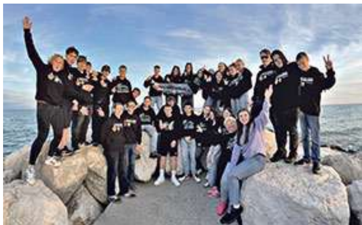
Die 9a und 9b genießen ihre Klassenfahrt am Meer von Cavallino, ehe es Mitte Juni mit den Abschlussprüfungen weitergeht.

Nach 5 Tagen kamen alle wieder gesund, munter, glücklich und zufrieden in Bad Staffelstein an.