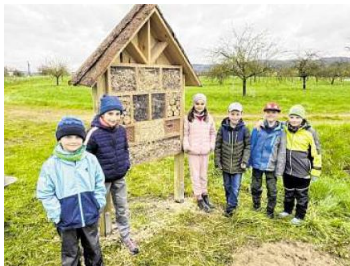
Im April haben die Schönbrunner Rosenkinder ein großes Insektenhotel auf der Streuobstwiese vor Schönbrunn aufgebaut.