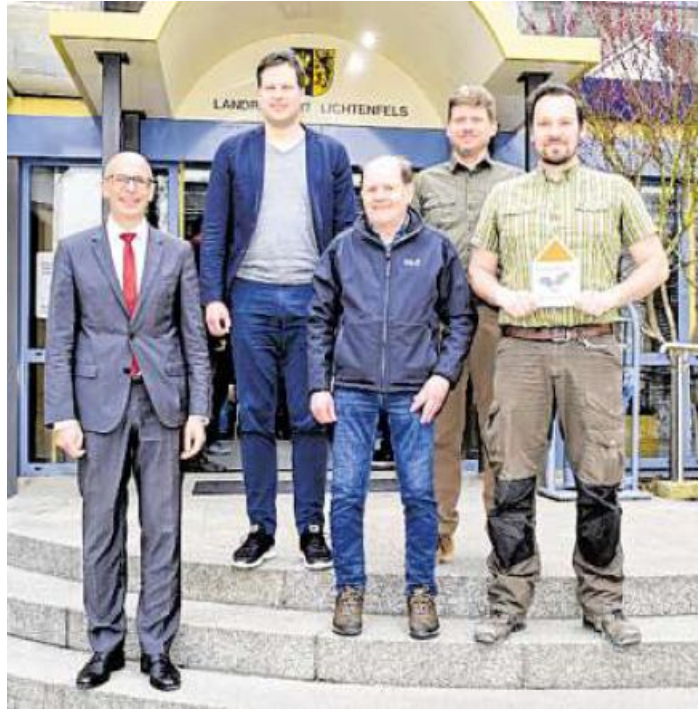
Die Preisträger aus dem Stadtgebiet von Bad Staffelstein.

„Durch die Auszeichnung und die Anbringung der Plaketten an Bauwerken wird die Öffentlichkeit