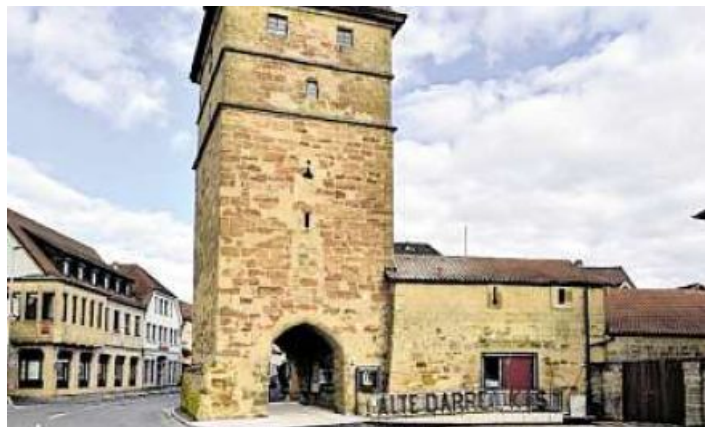
Im Bamberger Tortum („Stadtturm“) und in der benachbarten Alten Darre mit 100 Sitzplätzen veranstaltet die KIS die meisten ihrer Kultur-Events.