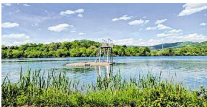
Neben gepflegten Sanitäreanlagen und Duschen gibt es einen Sprungturm und eine Wasserplattform.