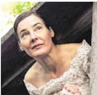
Der Fränkische Theatersommer spielt im Brückentheater.