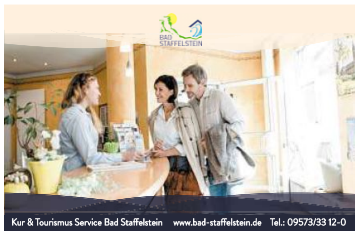
Kur & Tourismus Service Bad Staffelstein www.bad-staffelstein.de Tel.: 09573/33 12-0