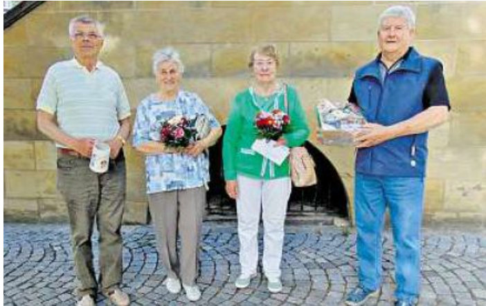
Die geehrten Urlaubsgäste, die seit zwanzig und dreißig Jahren regelmäßig ihren Urlaub in Bad Staffelstein verbringen.

Am Dienstag, 09. Mai 2023, konnte der stellvertretende Leiter des Kur & Tourismus Service, Markus Alin, treue Urlauber auszeichnen.