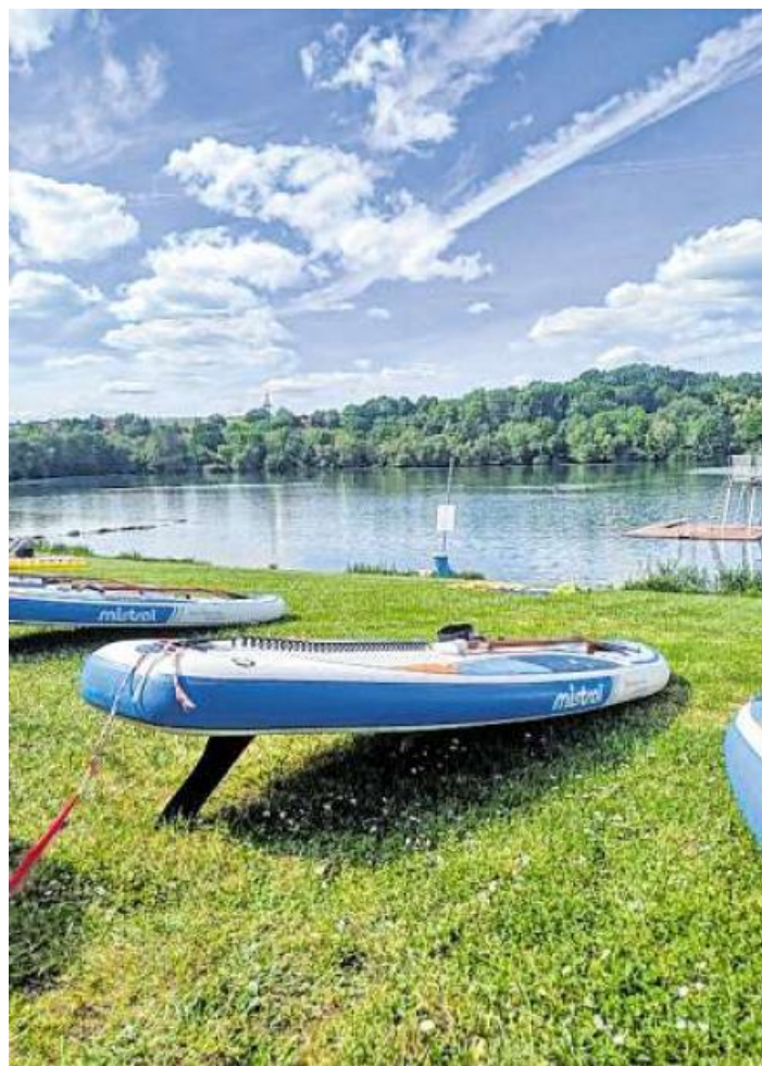
Kleine Revisionsarbeiten und einige Pflegemaßnahmen wurden bereits durchgeführt und der Antrag für die Auszeichnung „Blaue Flagge“ bei den zuständigen Behörden eingereicht.